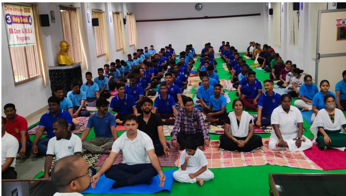
Cadets in Yoga Day