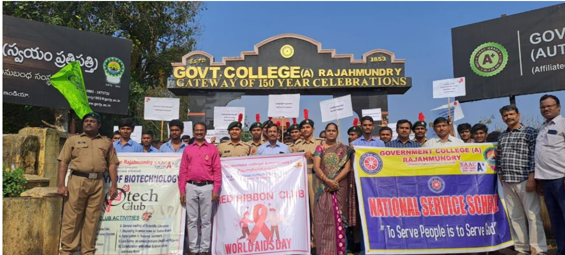
AIDS DAY RALLY

World Aids Day (1st December 2023): Government College Autonomous Rajahmundry observed World AIDS Day with the active involvement of NCC cadets and NSS volunteers. They took part in a rally organized for the occasion, and the cadets emphasized precautions to prevent AIDS transmission. Additionally, the cadets contributed to the event by participating in a blood donation program.