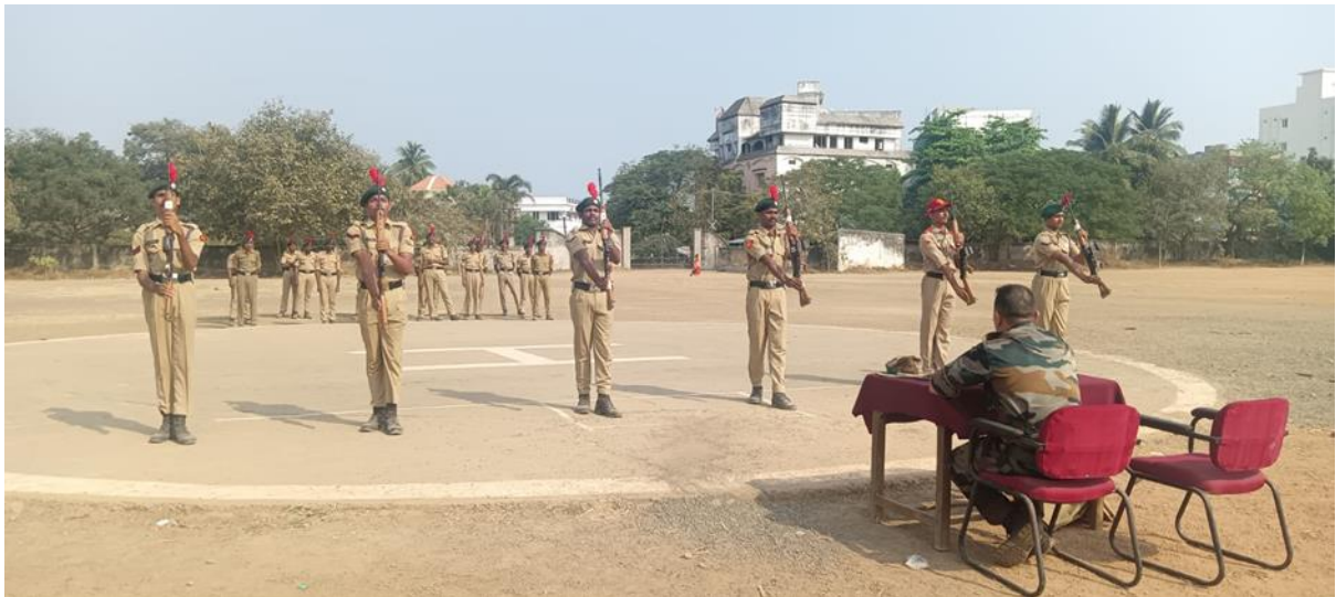
Training to the Cadets