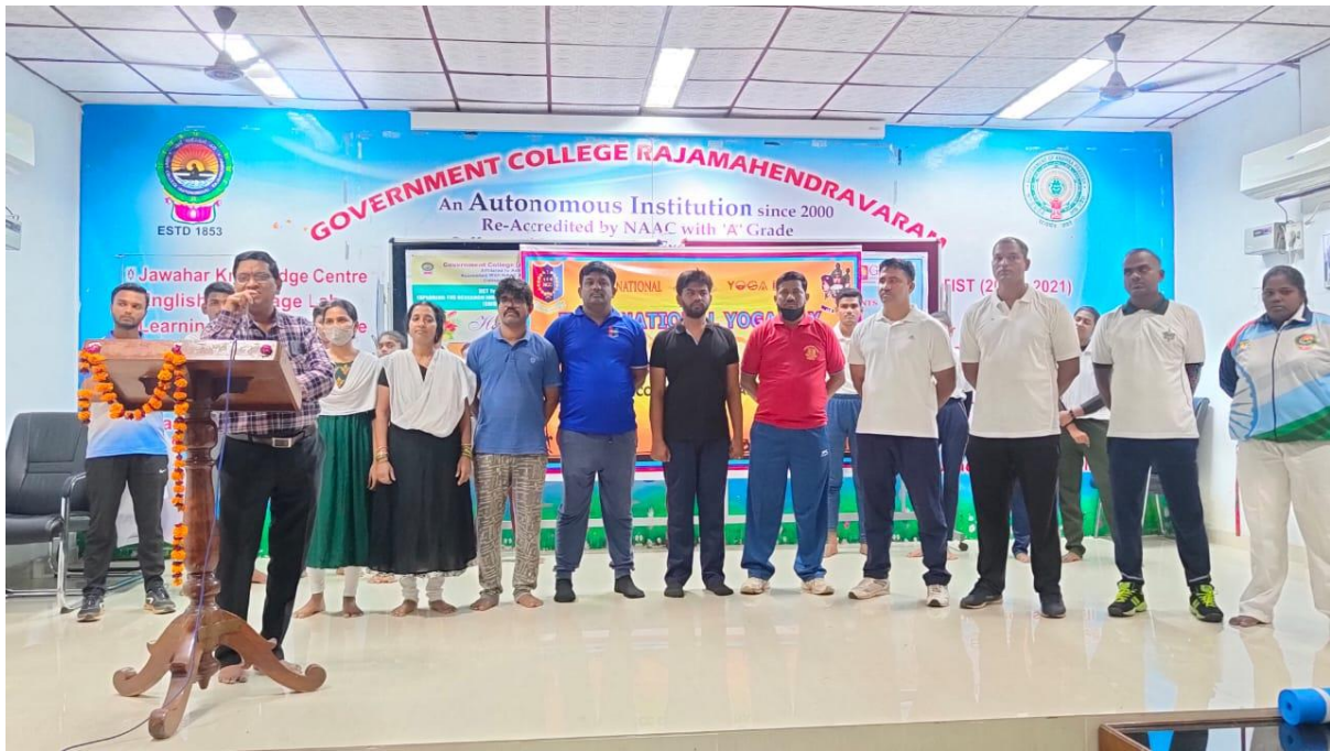
Faculty in Yoga Day Programme

International Day of Yoga ( June 21) : The college NCC cadets along with the NCC cadets of various institutions comes under the Rajahmundry sector of 18 (A) Bn, NCC and 3 (A) Girls Bn , NCC of Kakinada units have enthusiastically participated in the International Day of Yoga on June 21 2022 . The theme of the programme is to create awareness among the cadets about Physical and mental fitness among the cadets. 6 A.N.Os and 185 cadets have participated in the program.