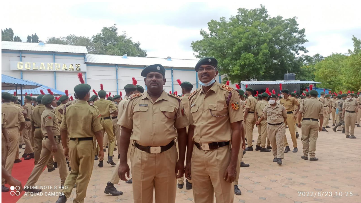
A.N.O in the Army Attachment Camp