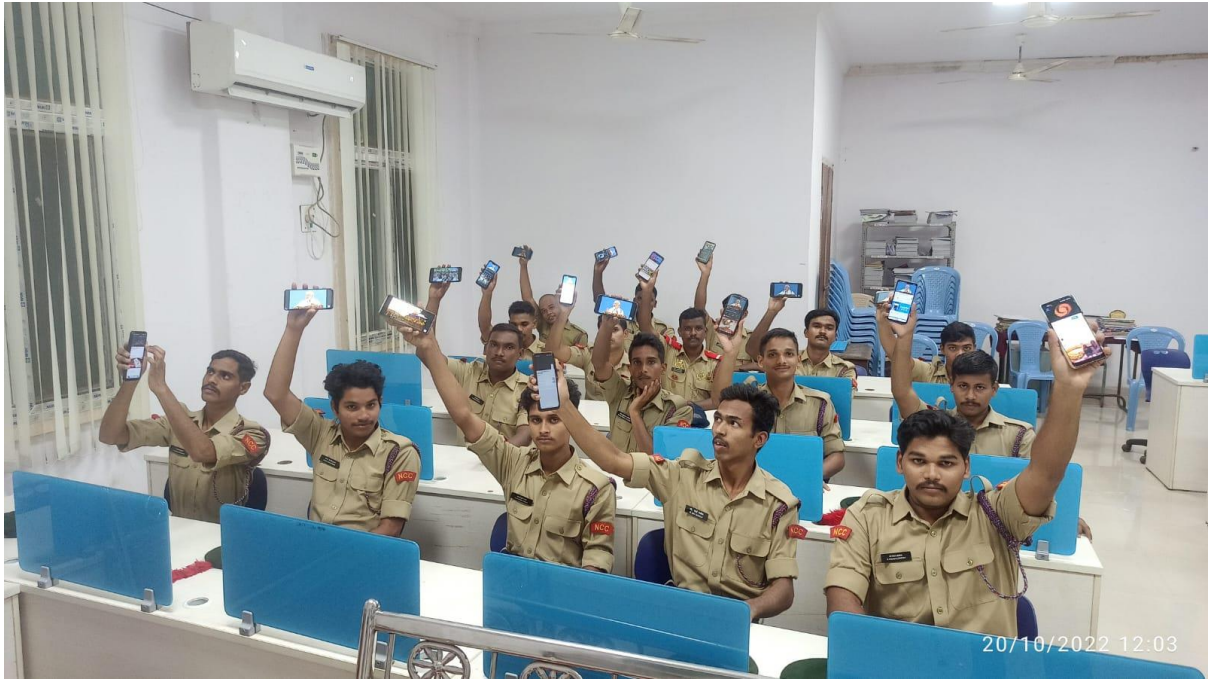
Awareness on Digital Transactions – Online Quiz