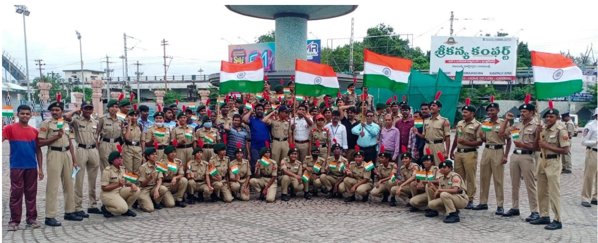
Students and Faculty actively participating in Azadi ka Amrut Mahotsav