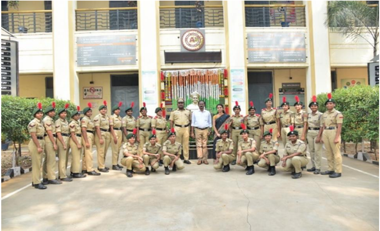
File Photo: Vice – Principal & A.N.Os with ‘C’ appearing Girl Cadets