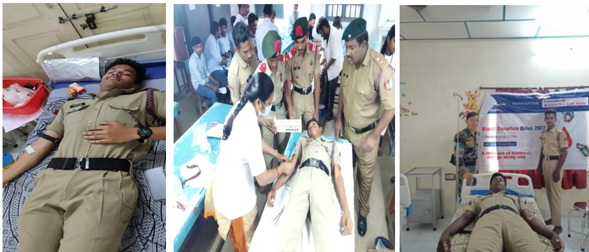
BLOOD DONATION BY THE CADETS ON THE OCCASION OF WORLD AIDS DAY