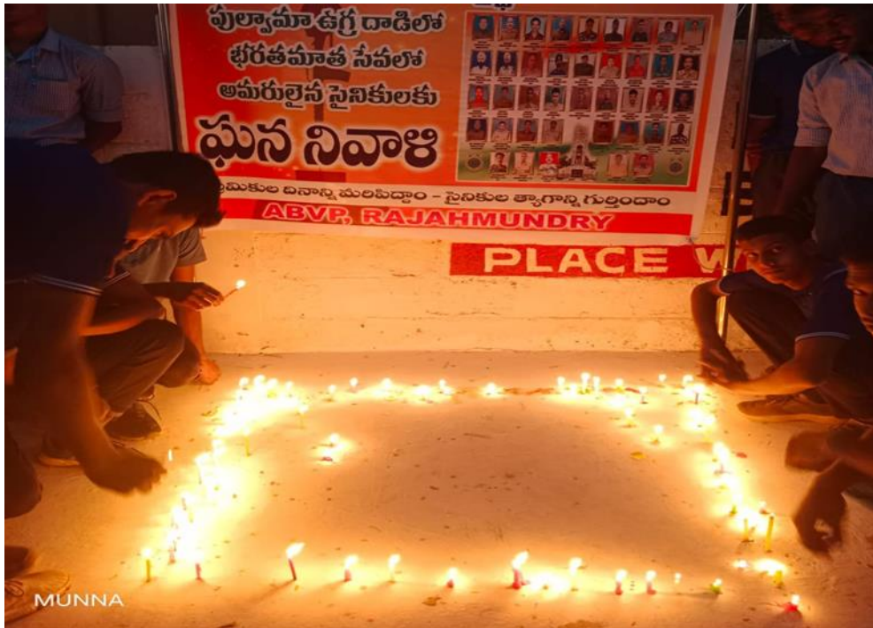
Tribute to Pulwama Martyrs