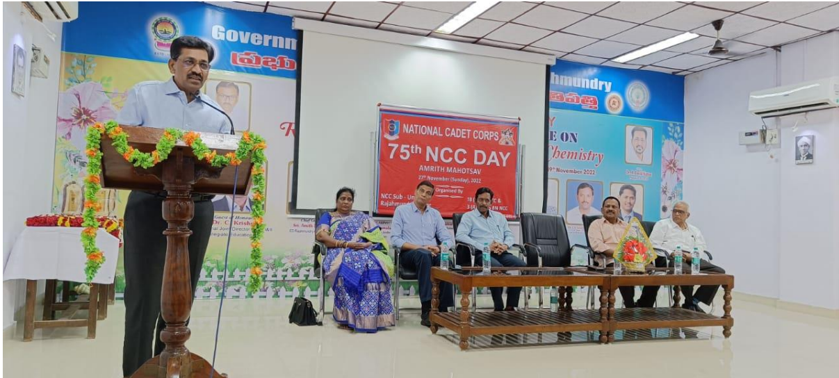
Joint Director Addressing the Cadets