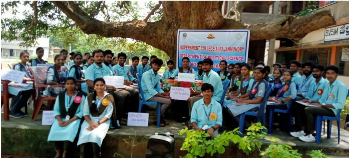
Group Photo - Faculty and Students of Government College (A), Rajahmundry, with School Staff and Students